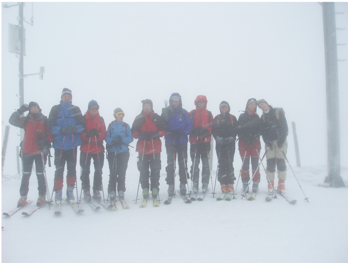
8.2.2009 SCHITOUR: Langeck, bei jedem Wetter