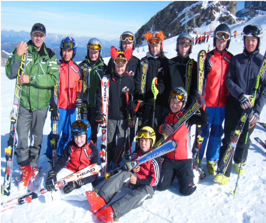
Schüler Power Herbst 2008 am Kitzsteinhorn

Resümee Trainingsgruppe Schüler: Bei einer sehr angenehmen Gruppendynamik, stand im Vordergrund die Verbesserung der Schitechnik um eine Sicherheit im Stangentraining zu erreichen.