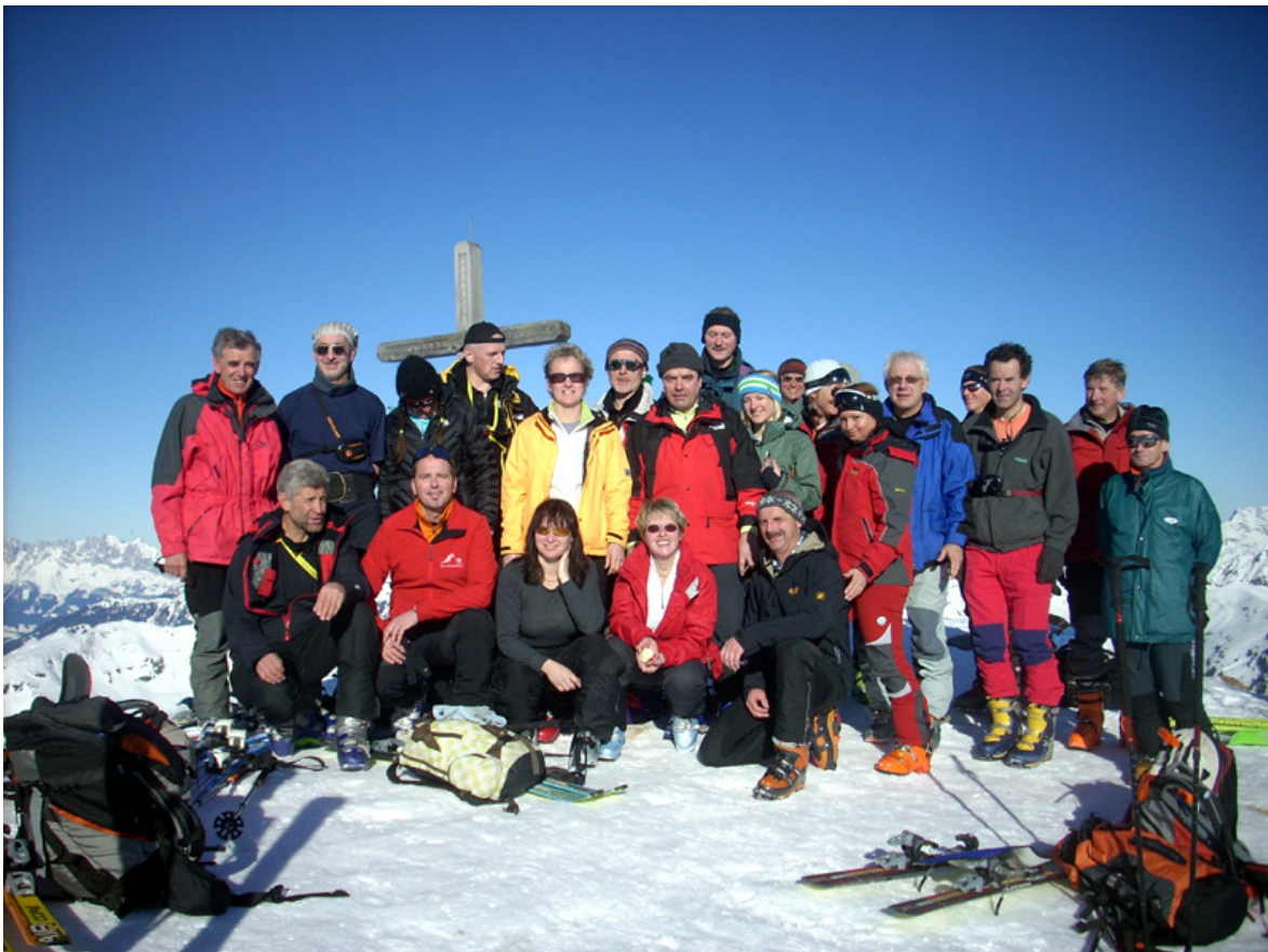
25.1.2009 SCHITOUR: Schusterkogel