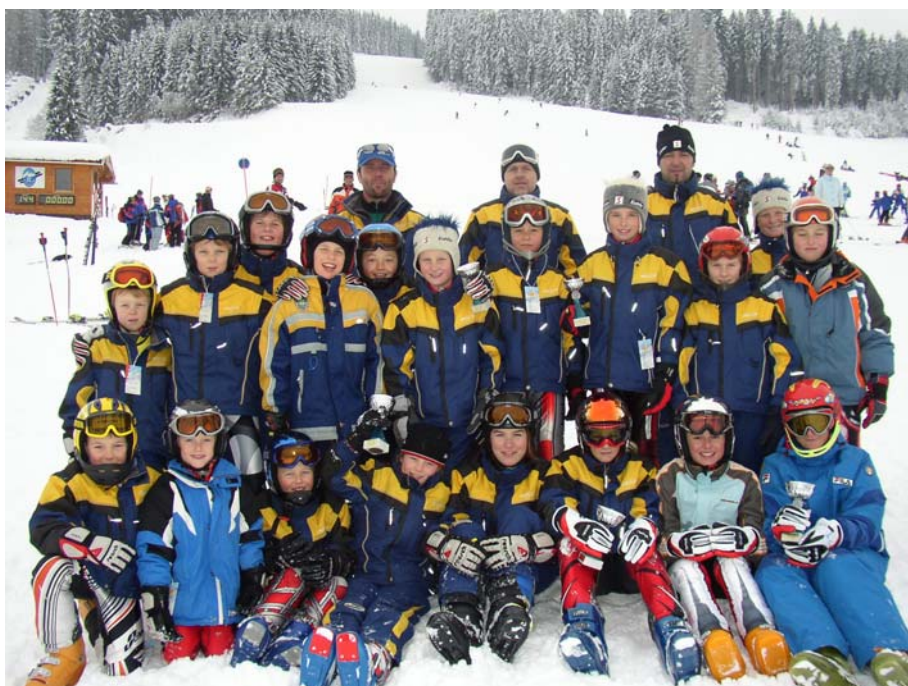
Schüler Fun mit Kindercup nach der Siegerehrung in Kaprun

Mit der Schüler Fun Trainingsgruppe wurde die Wintersaison mit dem Konditionstraining im Herbst begonnen, wobei sie parallel mit dem Kindercup mittrainierte. Hauptaugenmerk war Spaß am Schifahren. Die Läufer nahmen an den Kindercup- und Bezirkscuprennen teil.