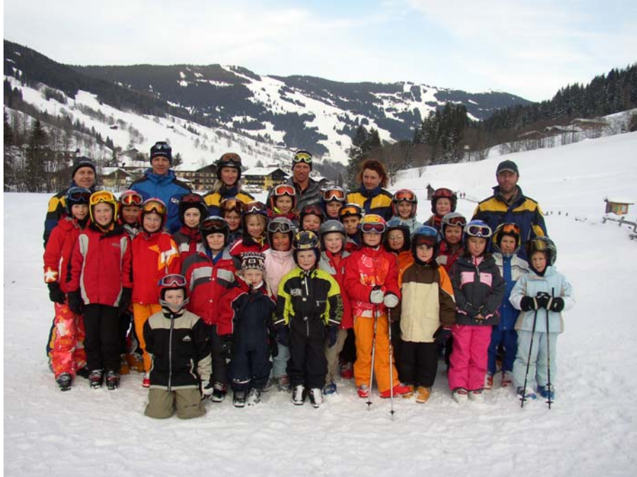
Foto nach einem Training unser Jedermanngruppe

Ab November trainierten wir mit der Jedermanngruppe wöchentlich in der Turnhalle der HS-Maishofen. Durch die super Schneelage im Dezember konnten wir schon sehr früh mit den Schneeeinheiten beginnen. Als Abschlussveranstaltung wurde im März das 3. Kinderpokalrennen durchgeführt. Ein großer Dank gilt den Trainern für die unentgeltliche Betreuung der Kinder.