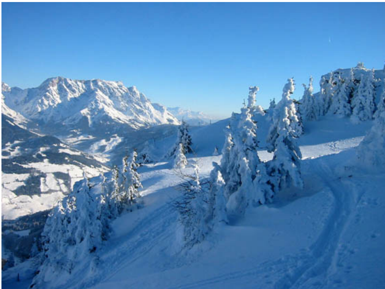
Impressionen auf der Marbachhöhe