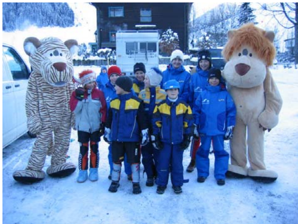
Aufstellung zum Einmarsch

Anfang Dezember fand bei traumhaftem Winterwetter das internationale Fila-Rennen am Unterschwarzachlift in Hinterglemm statt. 450 Starter aus 14 Nationen waren am Start. Auch der Sportklub Maishofen war mit einer kleinen Mannschaft vertreten. Besonderes imposant war der feierliche Einzug zur Siegerehrung.