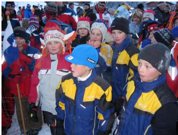
Gespannte Gesichter vor der Siegerehrung