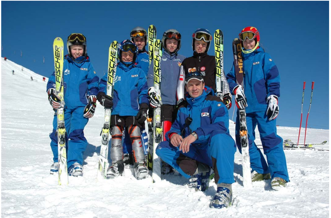
Schüler Power Mannschaft Training Schönleiten