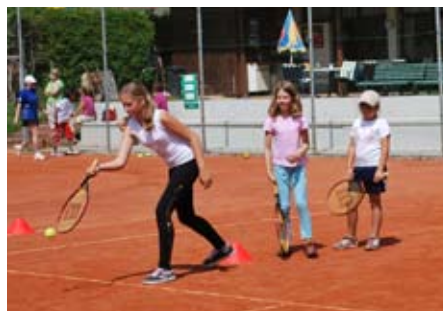
Am Maishofner Centercourt herrschte an den 5 Tagen der 1. Augustwoche reger Betrieb.