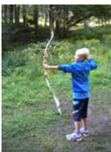
Der Bogenparcour Glemmerhof wurde täglich von 16 – 20 Maishofner Bogenschützen belagert und die Kinder hatten, in der für sie meist neuen Sportart, viel Freude.