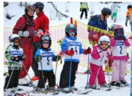
Gespannte Gesichter vor dem Start...

Zum Abschluss der langen Trainings- und Rennsaison fand am Sonntag, dem 13.03.2011 das 8. Maishofner Kinder & Schüler Pokal Rennen statt.