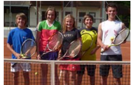
Die U15 Burschen wurden sehr gute 3., kräftig unterstützt durch unsere SKM-Girls!