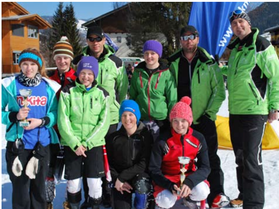
Bezirkscup-Finale in Hintertgletsch

Schon im Sommer des Vorjahres begannen die Vorbereitungen der Schüler-Power Gruppe auf die neue Saison mit einem Leistungstest und einem intensiven Heimtrainingsprogramm. Ab Oktober ging es dann auf den Gletscher, um sich so früh wie möglich an den Schnee zu gewöhnen. Neben den örtlichen Rennen wurden Bezirks- und Landesrennen bestritten.