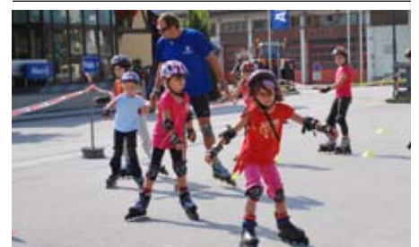
Ausgerüstet mit der nötigen Schutzausrüstung lernten die Neueinsteiger erste sichere Schritte, die Fortgeschrittenen konnten T-Bremse, Fersenbremse oder Spin-Stop beim Inlineskaten perfektionieren.