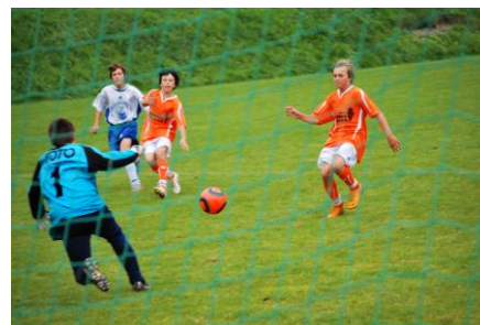
Spiel gegen St. Veit am 18.09.2010