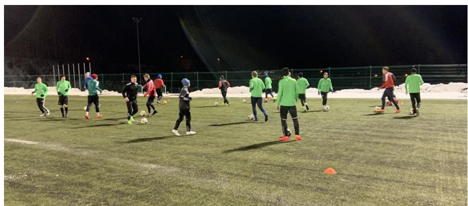
Aufwärmprogramm auf dem Saalfeldener Kunstrasen