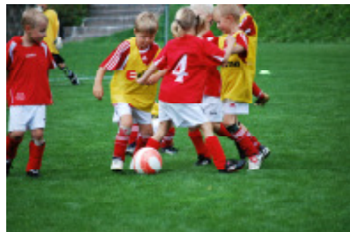
U7 beim Turnier auf heimischem Rasen am 13.09.2009.