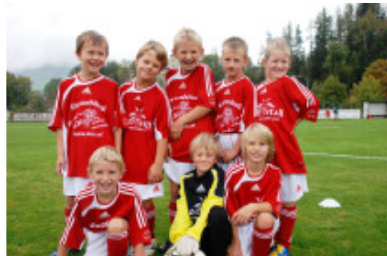
Die U9 Spieler haben richtig Spaß beim Training und bei den Turnieren.