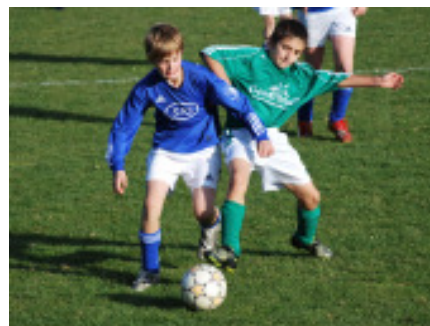
Das Spiel gegen den bis dahin ungeschlagenen Tabellenführer Maria Alm am 31.10.09 konnte in der Maishofner „Gruabn“ 3:2 gewonnen werden.