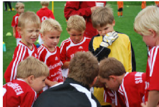
Die Jungs lauschen den taktischen Anweisungen ihres Trainers!