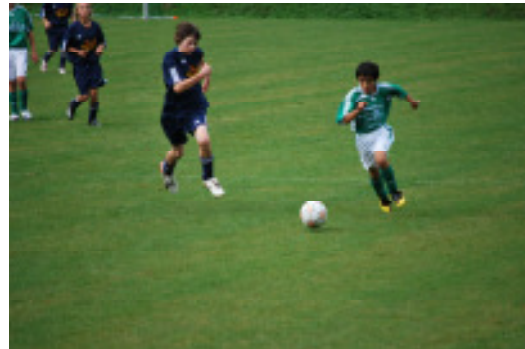
Spiel gegen Dienten am 11.10.2009