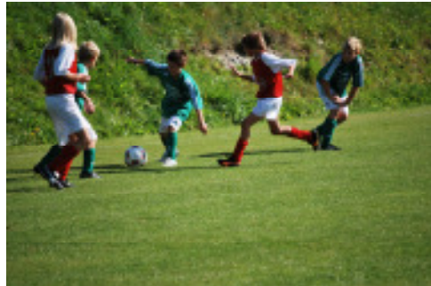
U 11 Mannschaft beim Heimspiel gegen Leogang am 27.09.2009