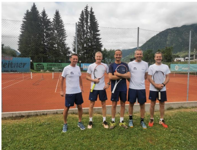
Die Herren45 kämpften mit Ausfällen und Verletzungen und halten sich seit Jahren trotz allem stabil in der LLA.