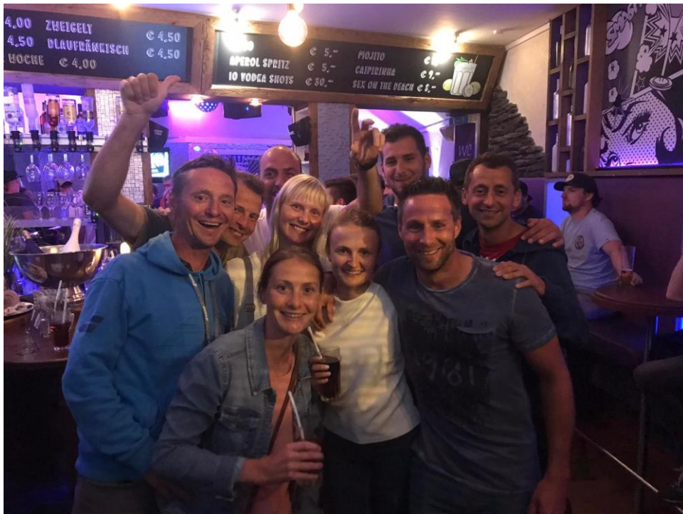
Nach dem Meistertitel darf man auch feiern!