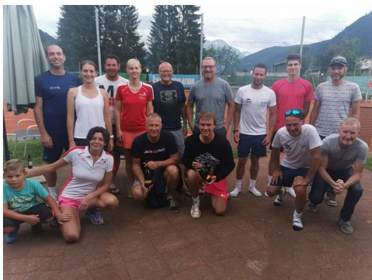
Die Teilnehmer bei der Doppel-Klubmeisterschaft 2021.